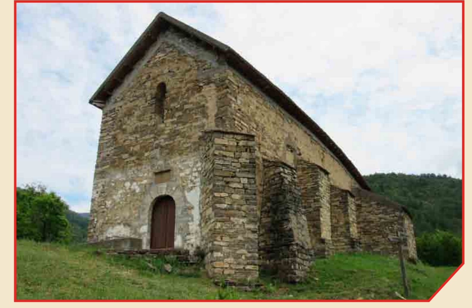
// Ermita de la Virgen de Catarecha.