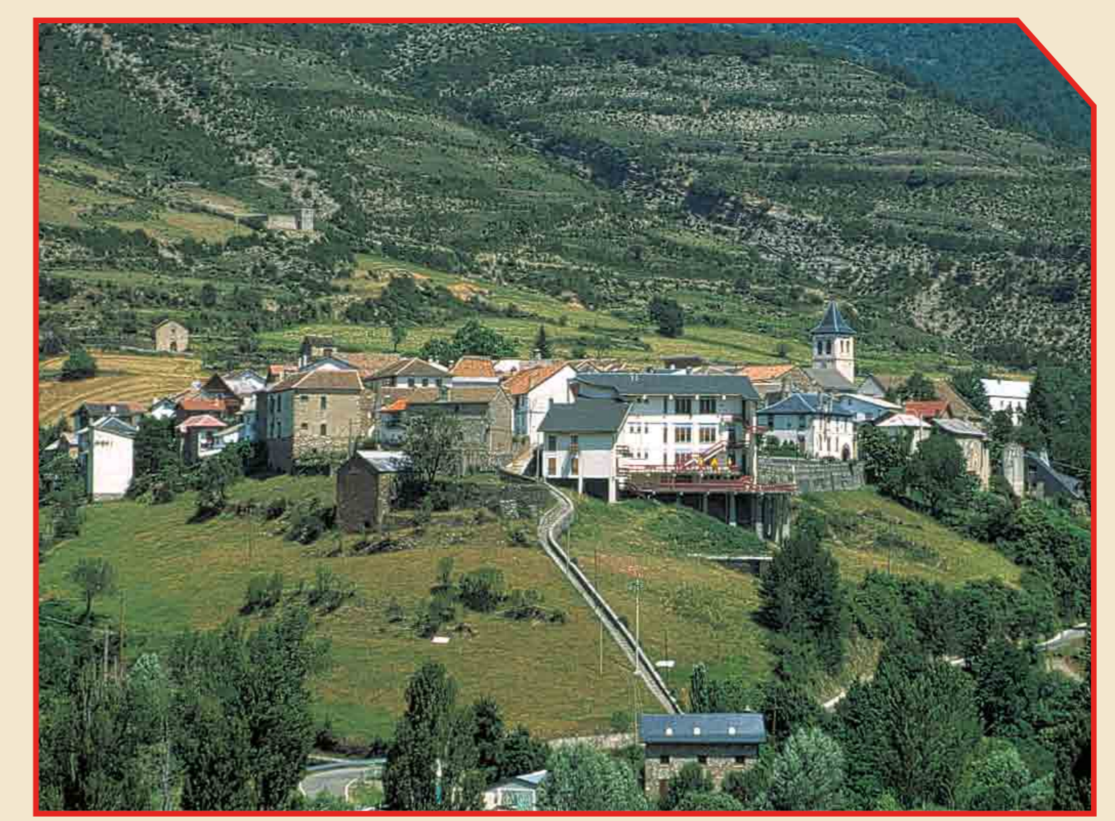
// Aragón del Puerto.

Mantén el entorno limpio. No arrojes basuras. Keep the area clean and tidy. Do not leave any litter.