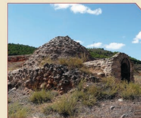
// Nevera de Ibdes.