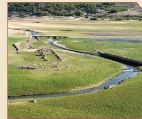
// Cola del embalse de la Tranquera (Nuévalos).