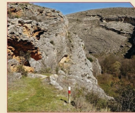
// GR 24 en el cañón de la Piedra (Nuévalos).