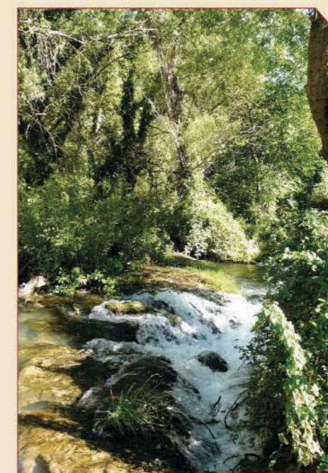
// Río Piedra (Nuévalos).

El GR 24 es un sendero de gran recorrido que procede del castellano señorío de Molina de Aragón y surca el confin occidental zaragozano y turolense de los valles del Mesa y Piedra y las tierras altas de Gallocanta y Jiloca hasta conectar con el GR 10 en la Comunidad de Albaracín. En su devenir por estos territorios de antigua frontera destacan por su monumentalidad y singularidad natural enclaves como el Monasterio de Piedra, los cañones y hoces de los ríos Mesa y Piedra, la laguna de Gallocanta, las minas de Ojos Negros o el castillo de Peracense.