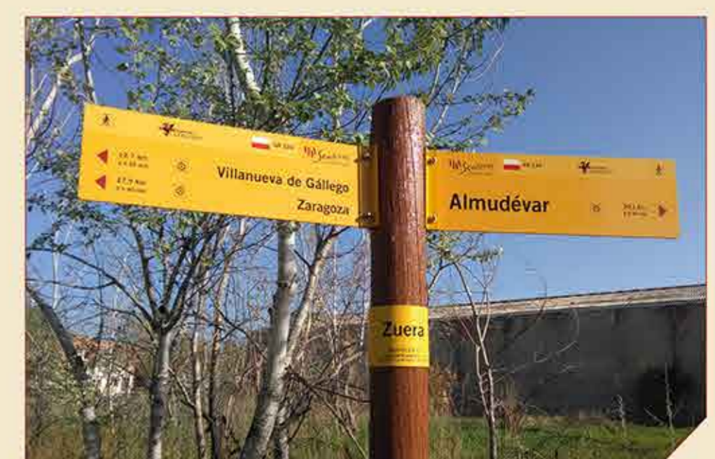
// Señalización del sendero GR 234