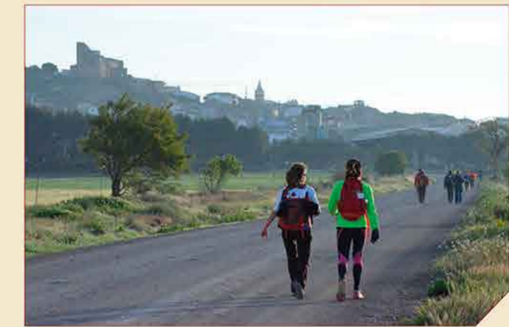
// Senderistas llegando a Almudévar

El GR 234 "Camino de la Jorjeada" es un sendero que enlaza en tres etapas la plaza del Pilar de Zaragoza con la ermita de San Jorge, en Huesca, uniendo en un recorrido norte-sur, o viceversa, las dos capitales provinciales. En sus 76 kilómetros discurre por pistas de tierra, caminos y antiguas cabañeras, atravesando los municipios de Zaragoza, Villanueva de Gállego, Zuera, Gurrea de Gállego, Almudévar y Huesca.