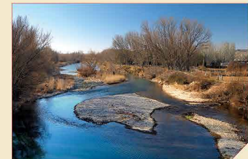
// Río Gállego a su paso por Zuera

Caseta de Valero es un importante punto de aprovisionamiento y descanso para el senderista de la Jorjeada celebrado el 23 de abril, ya que se encuentra a mitad de camino, cerca del límite provincial entre Zaragoza y Huesca, en el municipio oscense de Gurrea de Gállego. En el pasado, esta edificación abovedada tuvo una importante función como refugio agrícola y ganadero. Muy cerca de aquí se encontraba el ya desaparecido pueblo de colonización de Puilatos, construido sobre un terreno tan inestable que tuvo que ser completamente demolido.