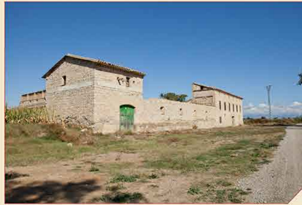
// Venta de la Violada

El GR 234 "Camino de la Jorjeada" es un sendero que enlaza en tres etapas la plaza del Pilar de Zaragoza con la ermita de San Jorge, en Huesca, uniendo en un recorrido norte-sur, o viceversa, las dos capitales provinciales. En sus 76 kilómetros discurre por pistas de tierra, caminos y antiguas cabañeras, atravesando los municipios de Zaragoza, Villanueva de Gállego, Zuera, Gurrea de Gállego, Almudévar y Huesca.