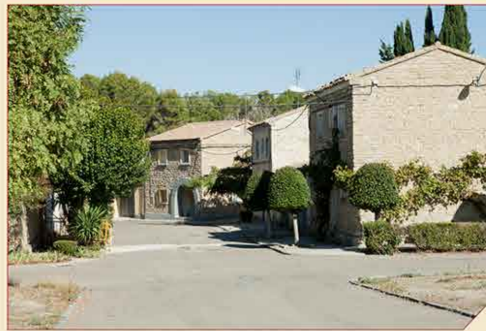
// Pueblo de colonización de San Jorge

To visit the small Huesca locality of San Jorge, it can be accessed from the crossing with the N-330, following the road access to the village; or else, continue the dirt trail that, parallel to the irrigation canal, starts just behind us.